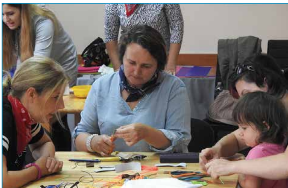
szorgos kezek a LIGET FESZTEN