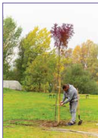
A fotók a tavalyi októberi faültetésen készültek.