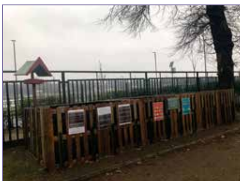
„akinek felesleges faanyaga vagy raklapja van, gondoljon ráunk...”

frakció jelentős része komposztálásra kerül. Ezáltal lehetőség nyílik a hulladékszállítási költségek csökkentésére, valamint nem kell majd virágföldet és műtrágyát sem vennünk.