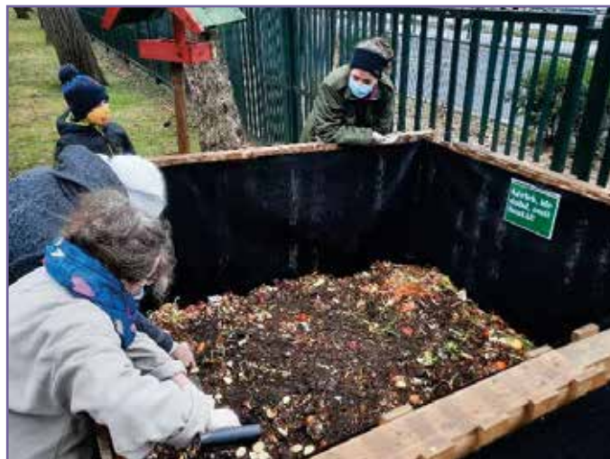
Szodligeten az Önkormányzat támogatásával kiválasztottuk az erre alkalmas területek közül az elsőt