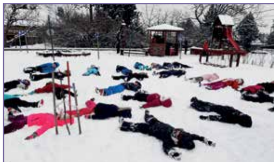
Olyan támogatást, praktikákat adunk a gyerekek kezébe, amivel később könnyebben fognak megbirkózni az akadályokkal.

Mindenképp megtartani a címet és felmenő rendszerben minden 4-6 éves gyermeket és a velük foglalkozó pedagógusokat bevonni a programba. Szerencsére nagyon sok ilyen irányú konferencia, workshop létezik, aminek