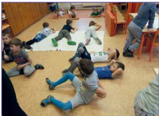
A program alapja a szabad kommunikáció, az egymásra való odafigyelés és a pozitív megerősítés

tok, boldogító jó cselekedetek, célok kitűzése és elérése, megküzdési stratégiák, apró örömök, megbocsátás és a mozgás öröme. Közösen haladunk hónapról hónapra, lépcsőről lépcsőre fel a Boldogság várba. Kolléganőmmel elhatároztuk, hogy belefogunk és kipróbáljuk, hogyan valósítható meg ez ebben a korban. Döbbenetes tapasztalataink voltak már az első alkalmakkor is, mert az ovis korosztály az érzéseiről - még ha néha nehezen is fogalmazza meg - beszélni akar, nem is keveset. Ennek a programnak pont az a lényege, hogy nem minősíti a gyermek érzelmeit, így ezen keresztül őt magát sem. Nagy tanítás ez gyermeknek és pedagógusnak is!