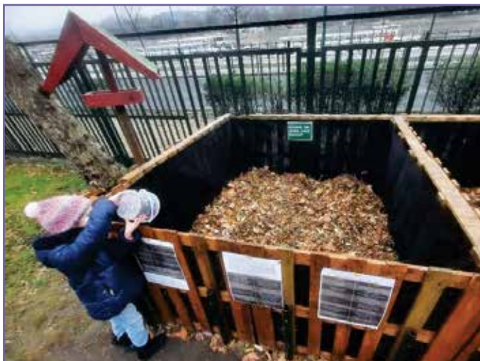
Gyerekek is részt vehetnek benne, számos pozitív hatása mellett környezettudatos szemléletre neveli őket.