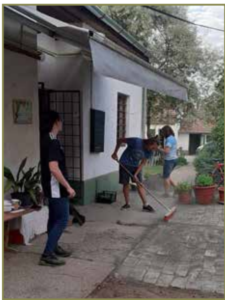
a sráccal nem csak beszélgettünk, nekik köszönhető az új „terasz”

- Mindenkinnek voltak online bejelentkező órái?