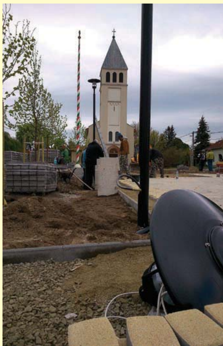
Épül az új főtér