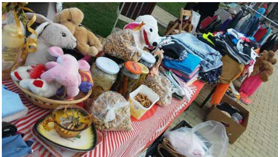
A kép nem illusztráció egy tavaszi közösségi vásárunkon készült.