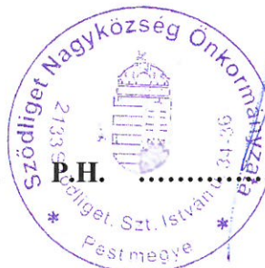
Megbízó Juhász Béla polgármester